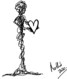
Garabato 5: Mi corazón en tus manos 1 (Mothú 2020)