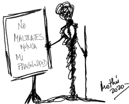
Garabato 5: No maltrates nunca mi fragilidad (Mothú 2020)

A veces somos nosotros los que no podemos hablar con la persona en duelo o tenemos miedo a hacerle daño y/o nos cuesta sostener su dolor. Cuando seas capaz de hablar con la persona, practica una escucha activa y empática , facilita su desahogo, dejándole expresar cómo se siente y las cosas que echa de menos de su familiar. Evita usar frases hechas , que lo único que hacen es minimizar el dolor.