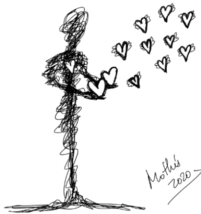
Garabato 12: Mi corazón en tus manos 2 (Mothú 2020)

Queremos resaltar la labor de todas las personas que durante estos días están sosteniendo nuestra sociedad y lo importante que está siendo el encontrarnos los/as unos/as a los/as otros/as en nuestros balcones y ventanas al finalizar el día como un recordatorio de que no estamos solos/as y como muestra de agradecimiento a los que están dándolo todo para superar esta crisis. Lo hacemos a través de este escrito.