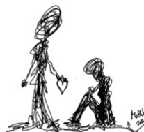
Garabato 10: No te rindas (Mothú 2020)