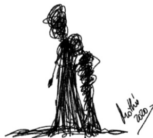
Garabato 3: Descansa en mi hombro (MoThú 2020)

Así mismo, las compañías funerarias están ofreciendo servicios de asesoramiento y acompañamiento psicológico a sus clientes. Infórmate sobre este servicio, puede ser de gran ayuda para estos momentos.