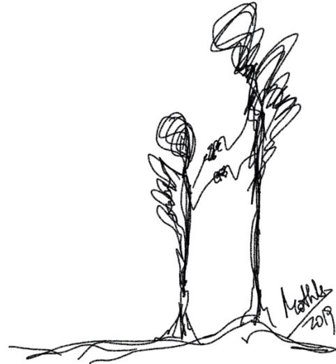
Garabato 6: Con tus alas (Mothú 2019)