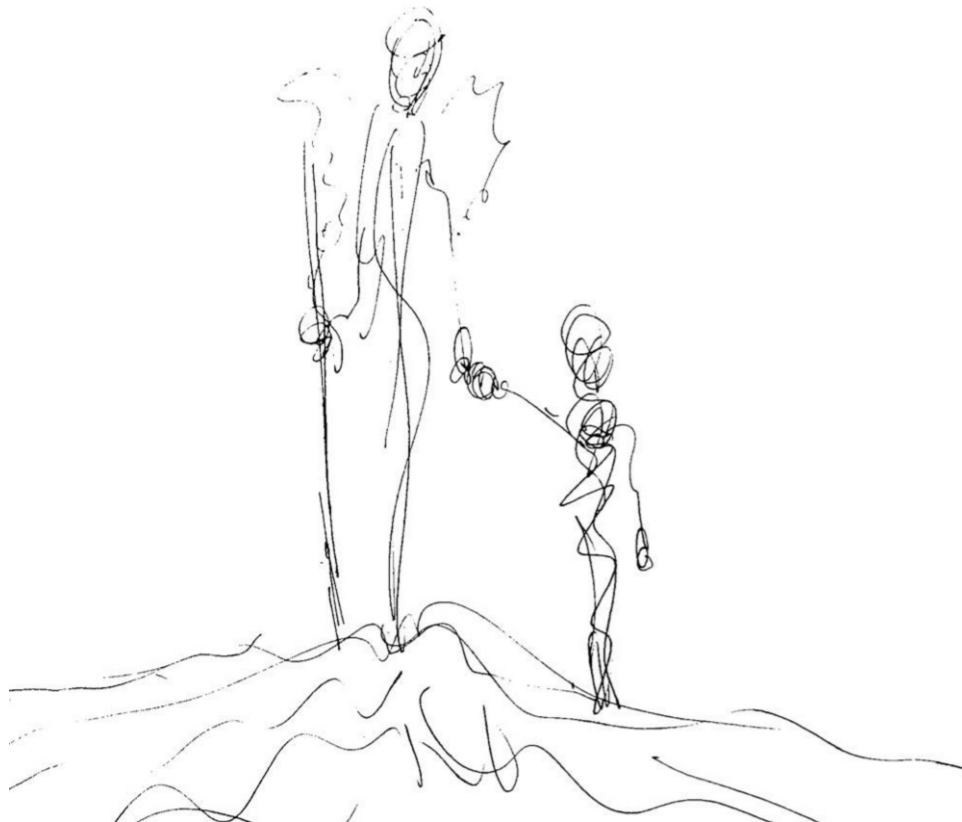
Garabato 1: Siempre contigo (Mothú 2019)

(Pautas elaboradas por profesionales especialistas en duelo y pérdidas)