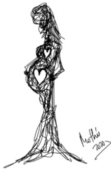
Garabato 8: La espera (Mothú 2020)

Si lloras, no te sientas culpable, la rabia, la tristeza son emociones válidas y necesarias, quizá sea el miedo que sale de ti, déjala que fluya, llorar sienta bien y alivia, lo importante es que manejes la intensidad de la emoción para no desbordarte en tu estado, que aprendas a regularte para no transmitir la angustia al bebé. Te proponemos que realices alguna pauta que te ayude a manejar tu emoción: