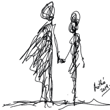
Garabato 7: Estoy aquí (MoThú 2019)