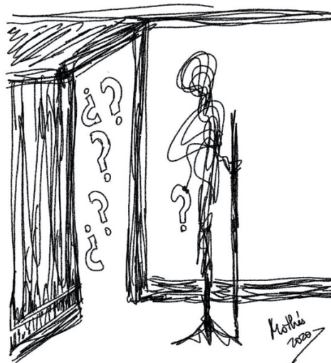
Garabato 2: Incertidumbre (Mothea 2020)

Por este motivo, esta pequeña red de psicólogas, trabajadoras sociales, enfermeras y terapeutas especializadas en pérdida y duelo hemos elaborado una serie de consejos que esperamos puedan ayudar a sobrellevar estos momentos tan difíciles de aislamiento e incertidumbre, ofreciendo otras formas que suplan esta necesidad de compartir y expresar el dolor con los demás y que al mismo tiempo nos permitan honrar la memoria de nuestros seres queridos fallecidos.